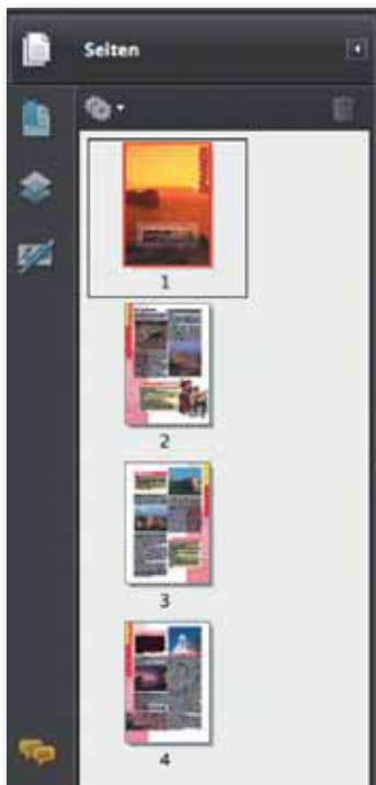
Eingeblendetes Navigationsfenster »Seiten«