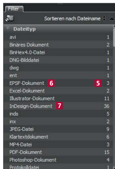
Abb. 2 Im Bereich FILTER werden alle Dateien automatisch kategorisiert und sortiert (oben). Ein manchmal typischer Projektordner am Anfang eines Projekts: alle möglichen Dateitypen durcheinander (rechts).

Möchten Sie nun z. B. nur die InDesign-Dateien sehen, klicken Sie auf das Wort INDESIGN-DOKUMENT 7 . So können Sie durch An- und Abklicken die Dateien jedes einzelnen Typs gezielt ein- und ausblenden.