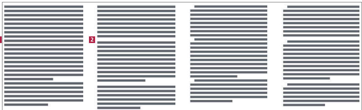
Abb. 1 Absätze ohne Raum dazwischen und ohne Einzug geben dem Auge keine Orientierungspunkte.

Schon dem Beginn Ihrer Absätze sollten Sie Ihre Aufmerksamkeit widmen. Es gibt mehrere Möglichkeiten, Absätze zu beginnen: z. B. mit oder ohne Einzug der ersten Zeile, mit oder ohne Leerzeile bzw. halber Leerzeile davor.