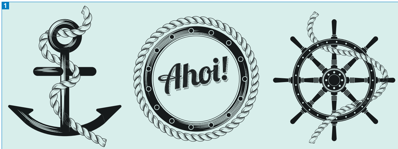
Die Ergebnisse des Workshops