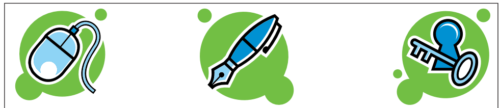
Abb. 2 Diese Symbole haben nicht dieselbe Aussage, sind aber konsistent gestaltet. Es ergibt sich ein angenehmeres Erscheinungsbild, das zusätzlich den Vorteil eines Wiedererkennungseffektes bei der Zielgruppe bietet.

Diese Symbolserie hingegen ist konsistent, weil sie über einheitliche Farb- und Stilmerkmale verfügt: