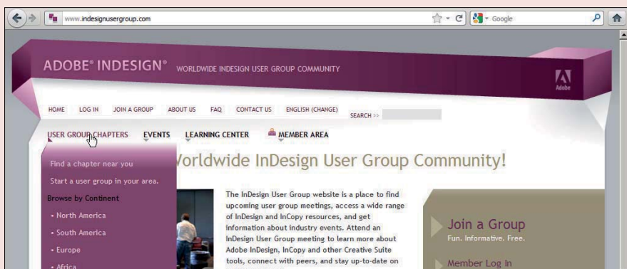
Die Startseite der weltweit tätigen InDesign-Anwendergruppen (»User Groups«). Von hier aus können Sie zu den einzelnen Standorten (»Group Chapters«) verzweigen und den nächstgelegenen finden.

Die Mitgliedschaft und die Veranstaltungen sind nicht kommerziell. In allen Anwendergruppen gibt es einige engagierte Leute, die für geeignete Veranstaltungsorte sorgen und regelmäßig hochkarä-