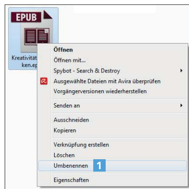
Abb. 1 Klicken Sie die EPUB-Datei unter Windows mit der rechten Maustaste an und wählen Sie aus dem Kontextmenü den Befehl UMBENENNEN .

1 Klicken Sie die EPUB-Datei im Windows Explorer mit der rechten Maustaste an. Aus dem Kontextmenü wählen Sie den Befehl UMBENENNEN 1 .