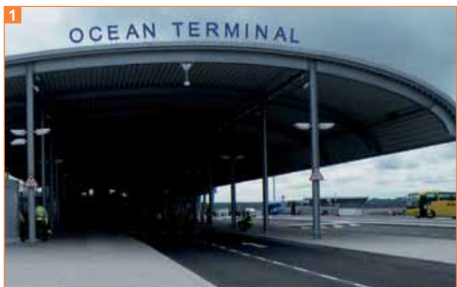
Einfache Perspektive und einfache Anordnung der Schrift

Bei einem frontal aufgenommenen Motiv wie diesem hier ist es einfach mit einem Pfadtext getan 1 .