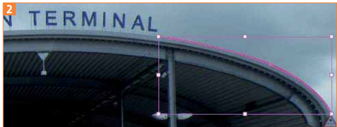
Die Linie zeichnen Sie sicherheitshalber etwas länger.

1 Zeichnen Sie mit dem Zeichenstift-Werkzeug einen Pfad entlang der Form des Dachs. Der Pfad sollte sicherheitshalber etwas länger sein, damit der Text daraufpasst 2 .